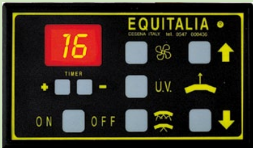
CENTRALINA DI COMANDO